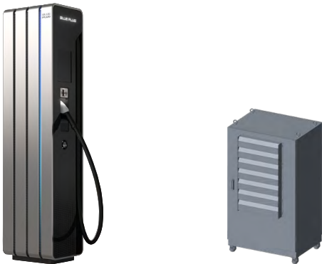
1채널 충전 포스트 (최대출력 360kW)